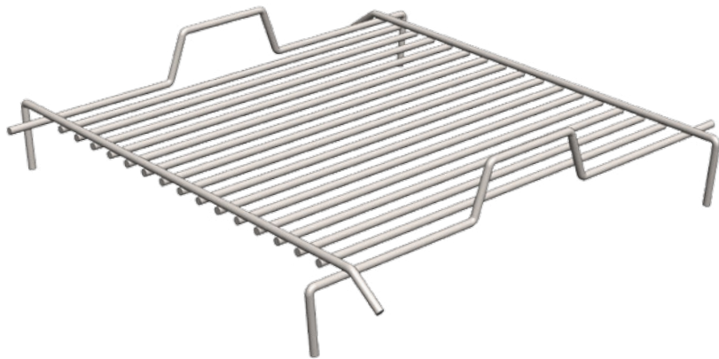
CUBE Grillrost CUBE Grid